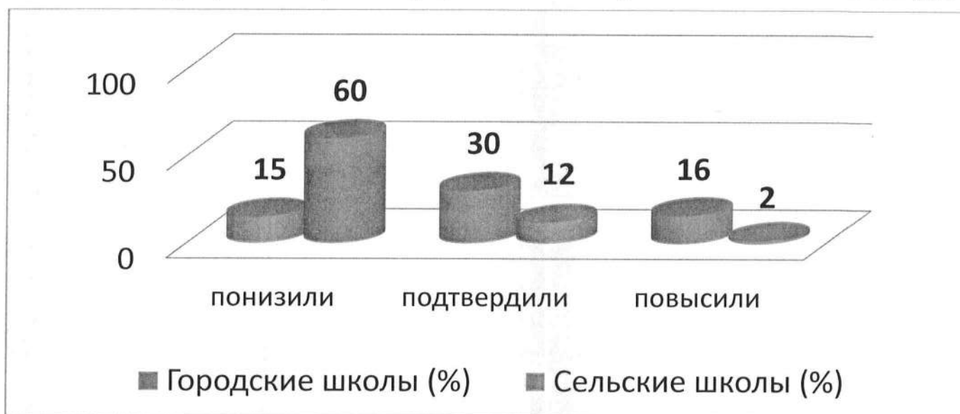
Диаграмма 2. Сравнение результатов мониторинга за 2020/2021-2022/2023 уч.г.

Понижение результатов, т.е. снижение индекса качества образования может быть объяснимо изменением пороговых значений, в том числе изменением критериев для кластеров.