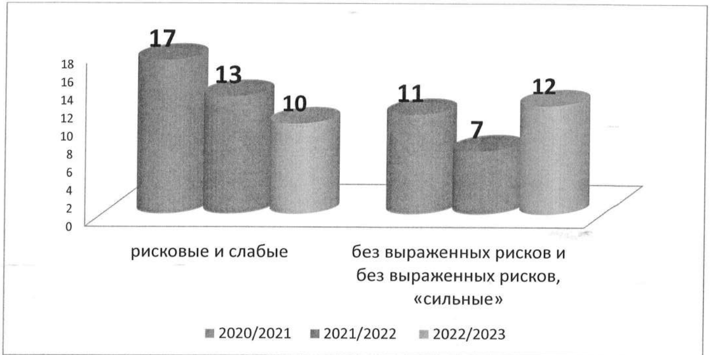
Диаграмма 3. Доля ОО, имеющих один рисковый профиль на всех реализуемых уровнях образования за 2020/2021-2022/2023 уч.г.

на всех уровнях стабильно снижается, а доля, школ «без выраженных рисков» и «без выраженных рисков, сильных» нестабильна, но значительно выросла по сравнению с предыдущим учебным годом.